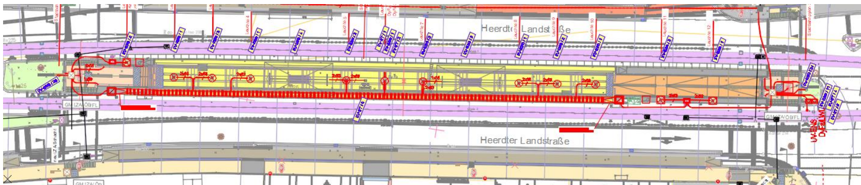
Lageplanauszug des geplanten Hochbahnsteigs Hast. Heesenstraße