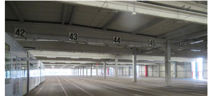
Ansicht der Halle 2

Gegenstand der Beauftragung an bt-plan waren Planungsleistung zur beleuchtungstechnischen Sanierung.