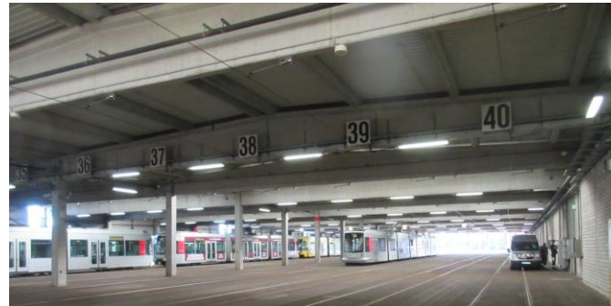
Ansicht der Halle 1