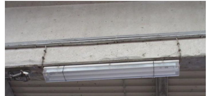
Bestandsleuchte Halle 2